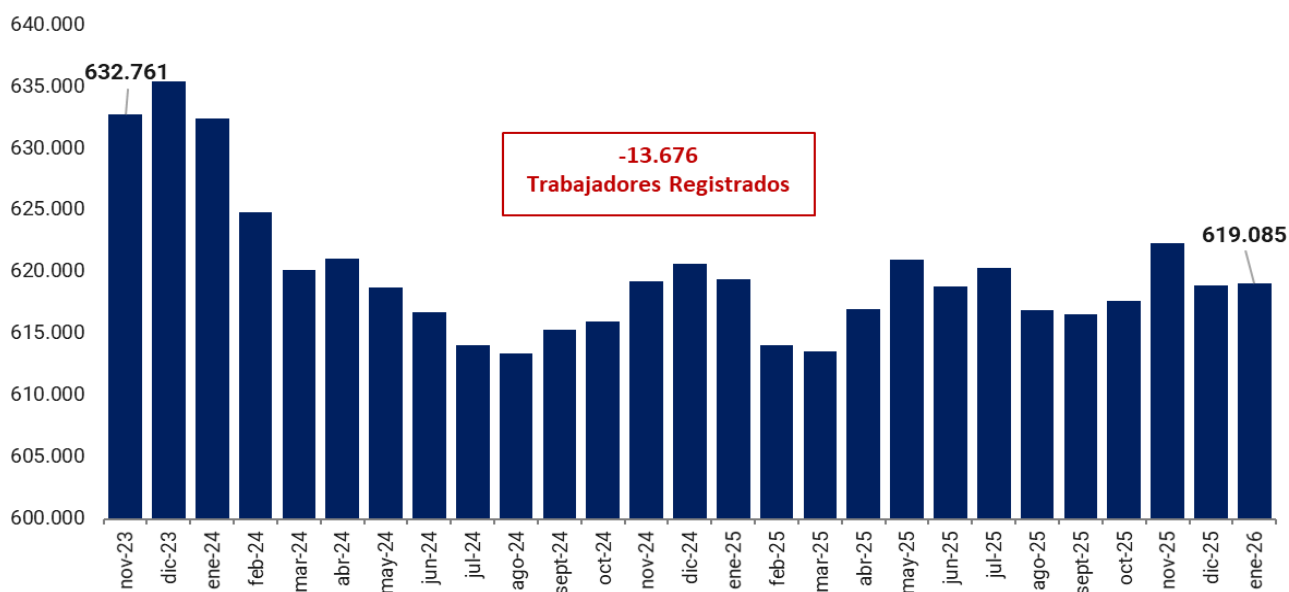
Gráfico 2. Evolución de la cantidad de trabajadores. Período: noviembre 2023 – enero 2026