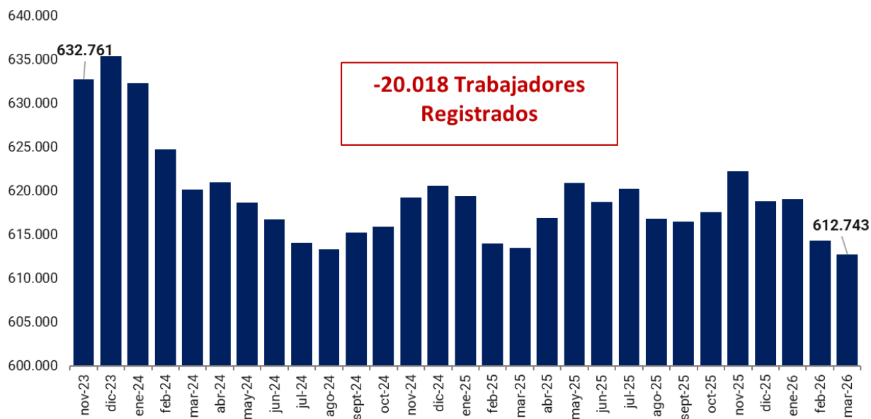
Gráfico 2. Evolución de la cantidad de trabajadores. Período: noviembre 2023 – marzo 2026